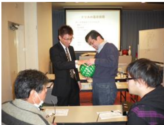
スパン等測定風景